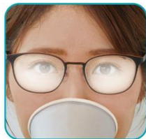
曇るレンズ ※通常レンズ (VPコートレンズ)

また、レンズ両面に「吸水層」を持つ特殊なコーティングを施す技術により優れた曇り低減性能を発揮。通常レンズ（弊社 VP コート）と比較すると、約 3 倍くもりにくい結果となりました。（社内調査：40 度の蒸気試験）