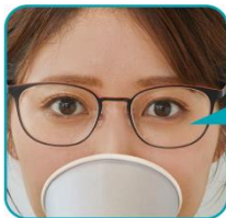
くもりにくいレンズ ※使用環境や状況によって 曇ることがあります。